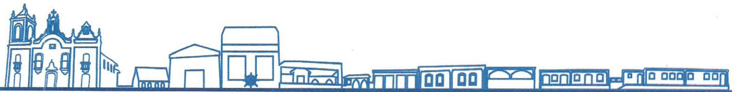
CLAUDIO LUCIANO DA SILVA XAVIER Prefeito Municipal

Gabinete do Prefeito, aos 06 de abril de 2016.