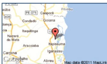
Figura 1 . Mapa do município de Itapissuma.